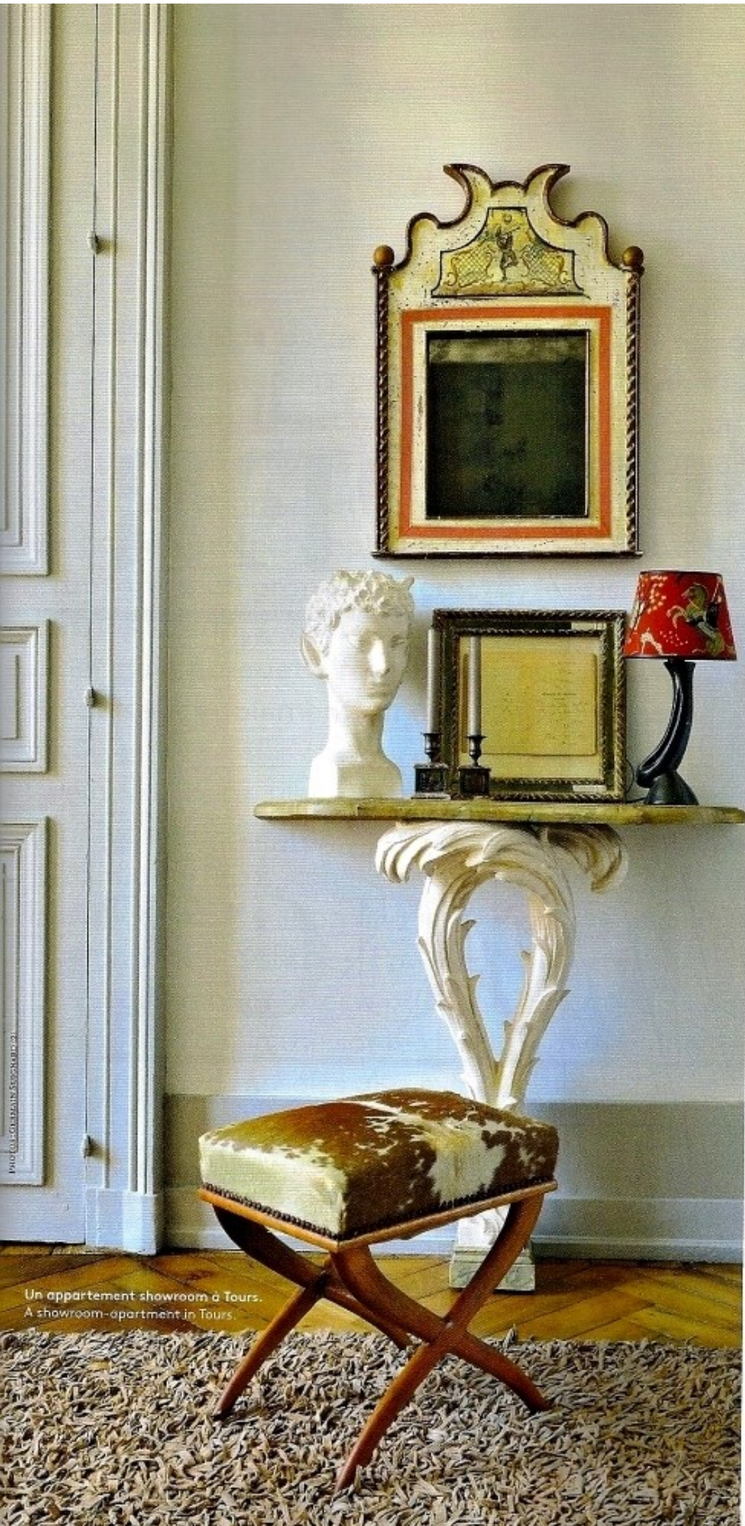
Un appartement showroom à Tours. A showroom-apartment in Tours.